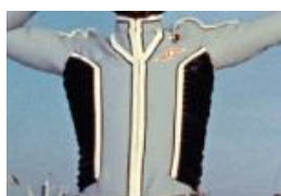
ウルトラ警備隊隊員服

作品に登場した「ウルトラアイ」「ウルトラ警備隊隊員服・ヘルメット」「ビデオレシーバー」「作品シナリオ」などを特別展示。作品の世界観を間近でご体感いただけます。