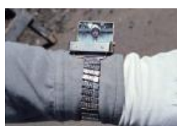
ビデオレシーバー