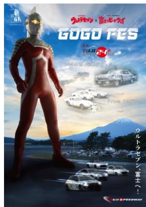
オリジナルキービジュアル

富士スピードウェイは5月26日(金)・27日(土)・28日(日)に開催する「ENEOS スーパー耐久シリーズ 2023 Power by Hankook 第2戦 NAPAC 富士 SUPER TEC24 時間レース」において、「ウルトラセブン&富士スピードウェイ」コラボレーションイベント「GO GO FES」を開催します。