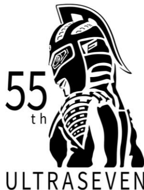
『ウルトラセブン』55周年記念ロゴ

1967年の放送開始から55周年を迎えた『ウルトラセブン』。物語では、重厚な人間ドラマに加え、対立する異星人とも分かり合おうとする姿勢など「共生と対話」をテーマにした未来が描かれました。