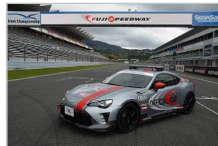
ゴールブリッジでの記念撮影 (イメージ)