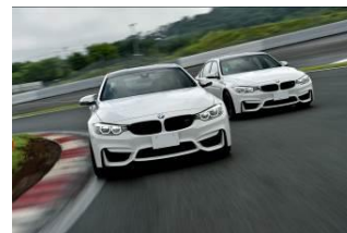
TRY! スポーツ走行 (イメージ)

また、当日 FISCO ライセンスを取得されるお客様には、割引料金が適用となるほか、 ゴールブリッジでの記念撮影 もお楽しみいただけます。