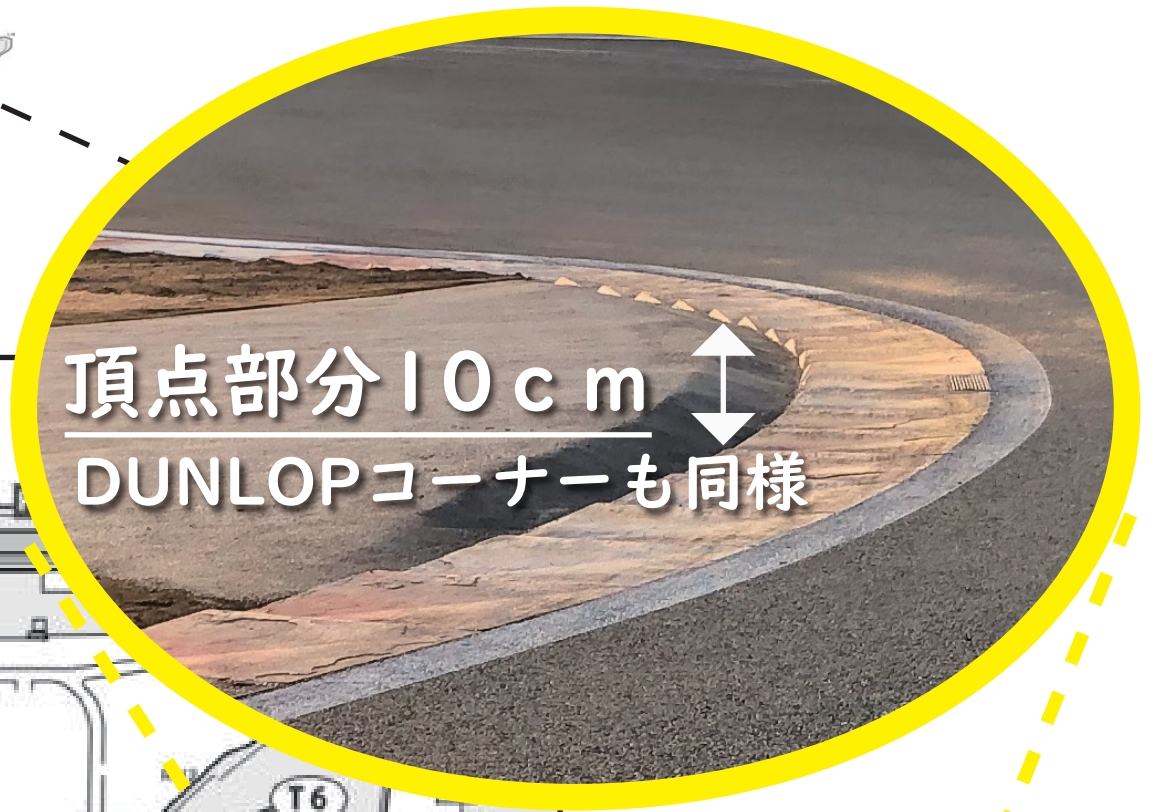
頂点部分10cm DUNLOPコーナーも同様