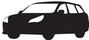
ステーションワゴン