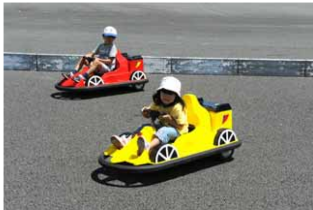
【キッズバッテリーカー】