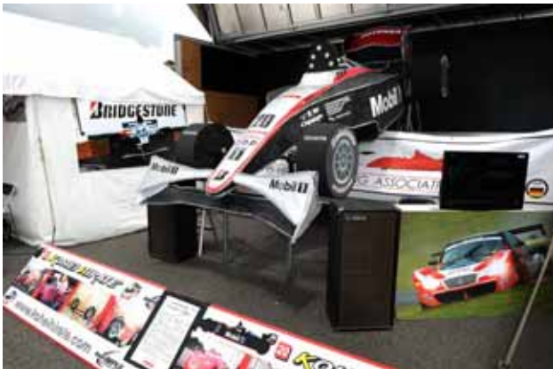
【フォーミュラ・ニッポン山車】