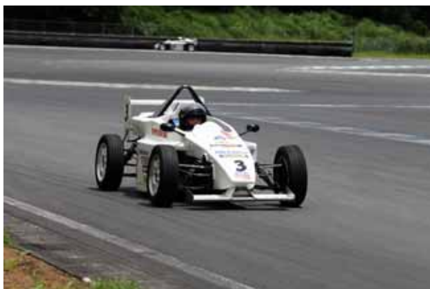
【ライトフォーミュラ体験試乗】