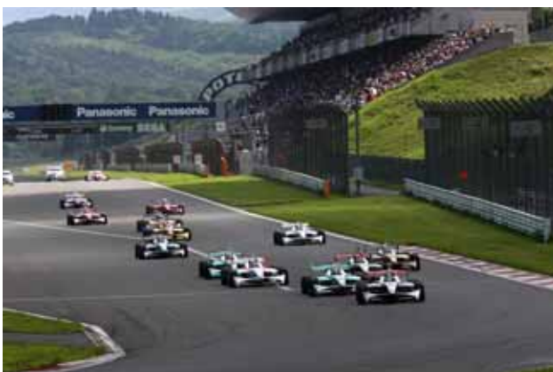
【フォーミュラ・ニッポン第3戦決勝レーススタート】