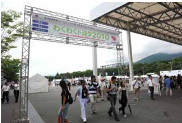
【わくわくトヨタ2010ゲート】