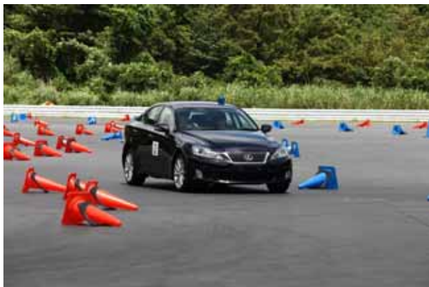
【スムーズスラロームチャレンジ】