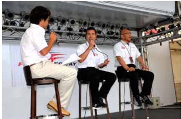
【エンジン開発者トークショー】