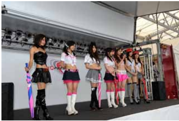
【レースクイーンステージショー】