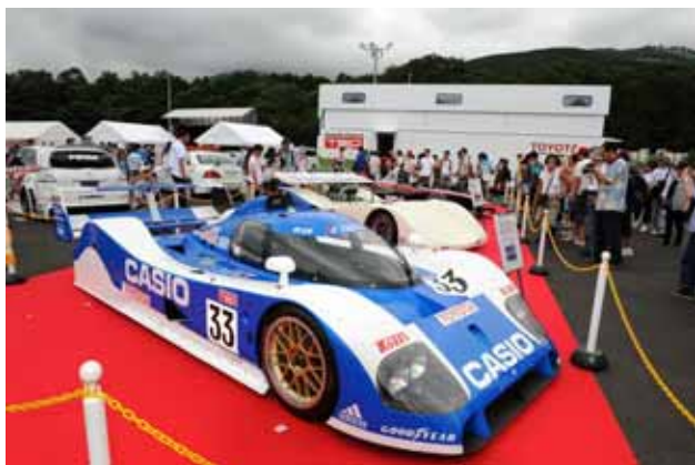
【トヨタ TS010 TOYOTA7 展示】