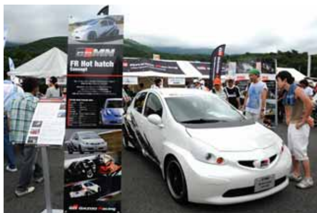
【Gazoo Racing 車両展示】