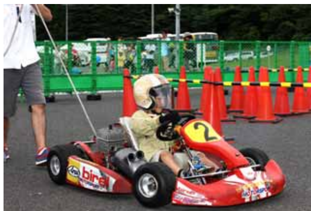
【キッズカート教室】