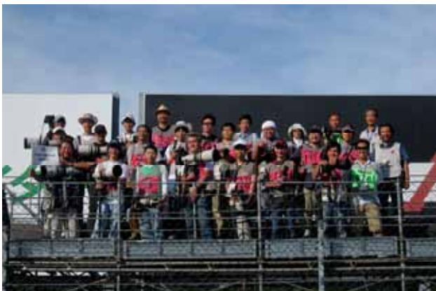
【撮影講習会 第1コーナー】