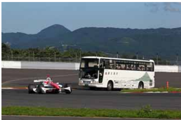
【サーキットサファリ】