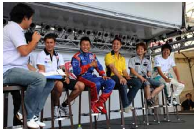
【ドライバートークショー】