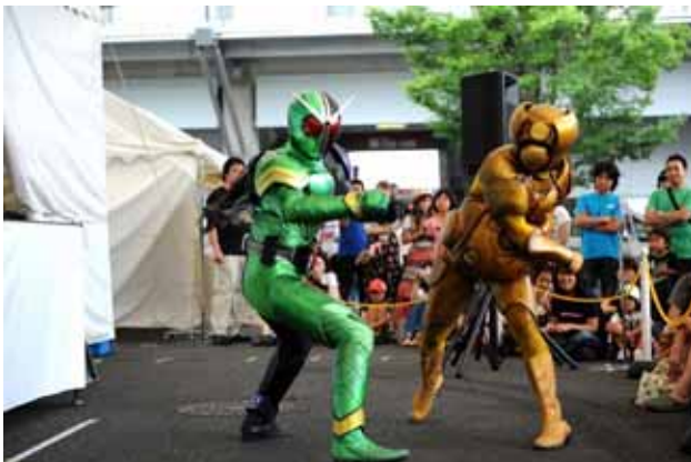
【仮面ライダーダブル・ショー】