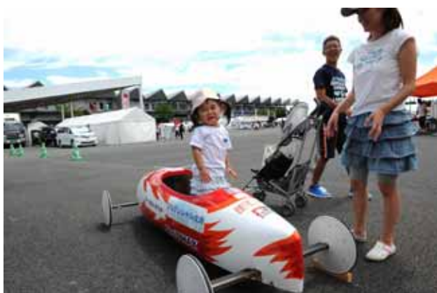
【ソープボックスブース】