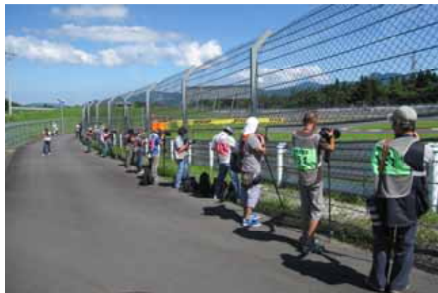
【撮影講習会 ダンロップコーナー】