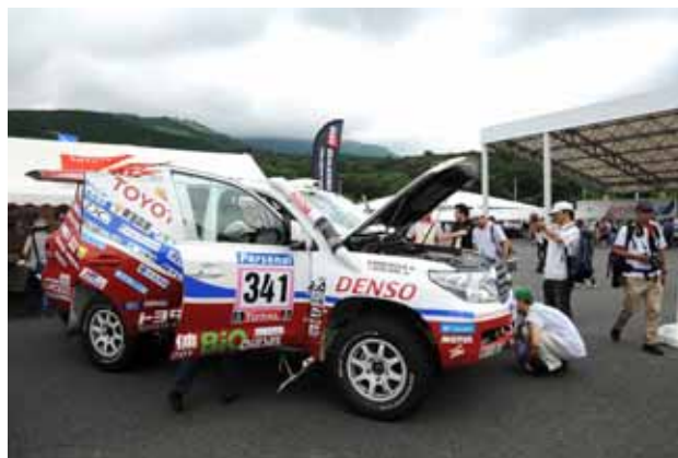
【ダカール・ラリー優勝車展示】