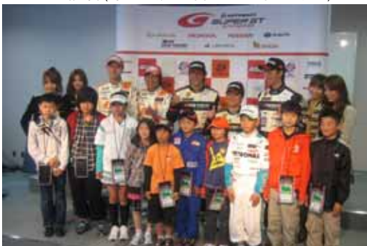
【キッズ記者(予選会見で各クラス1位選手と)】