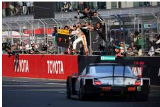
【MJ KRAFT SC430(#35)ゴール】