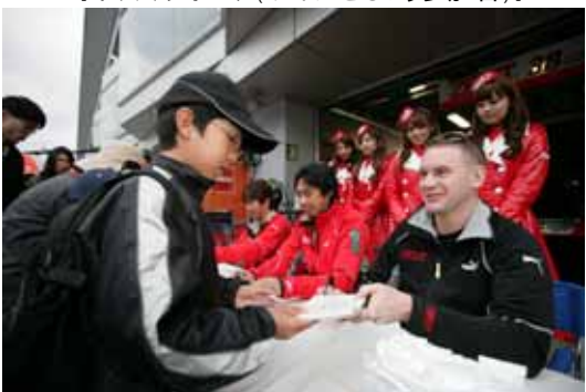
【キッズウォーク(サインをもらおう参加者)】