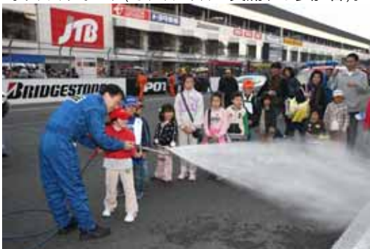
【キッズウォーク(オフィシャルと交流する参加者)】