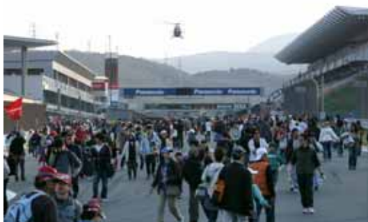
【コースウォーク(ホームストレート)】