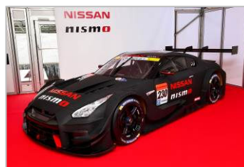
NISSAN GT-R NISMO GT500